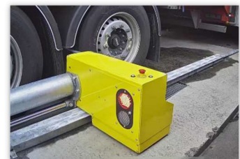
Wielkeggen met automatische positionering