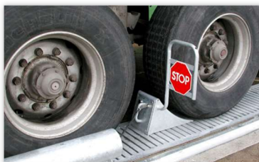
Wielkeggen met manuele positionering