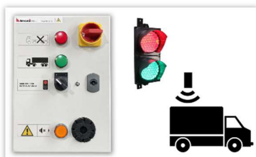
Veiligheidsbox & aanhangwagendetectie

Dankzij de risicoanalyse kunt u kiezen voor de oplossing die het beste past bij uw situatie en zo uw blootstelling aan risico's optimaal beperken!